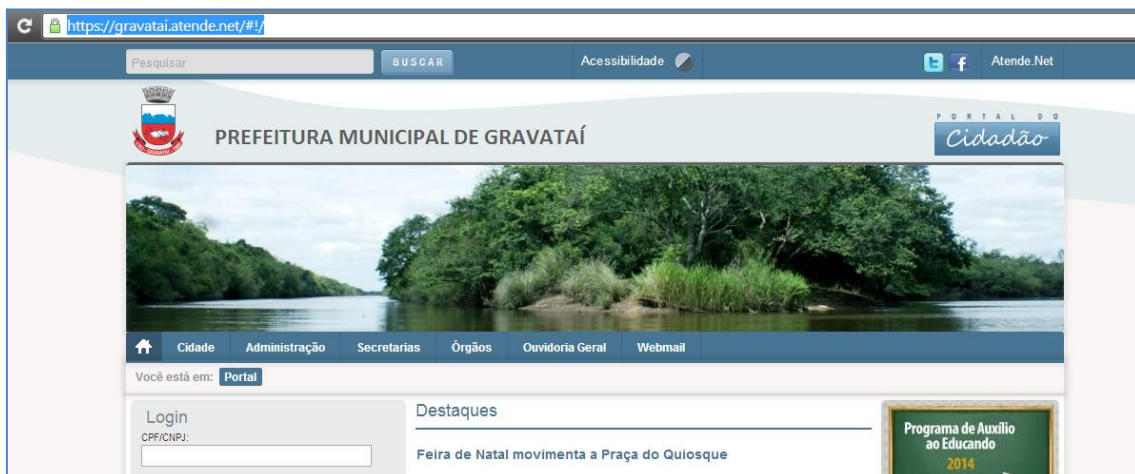
Imagem do site abaixo. Lembre-se de repetir no site todos os passos descritos aqui no manual.

Dirija-se ao sítio https://gravatai.atende.net/ que é onde encontrará a opção de Cadastro. IMPORTANTE: Não é o site do IPAG o lugar onde deve ser acessado o contracheque, mas sim no próprio sítio da prefeitura.